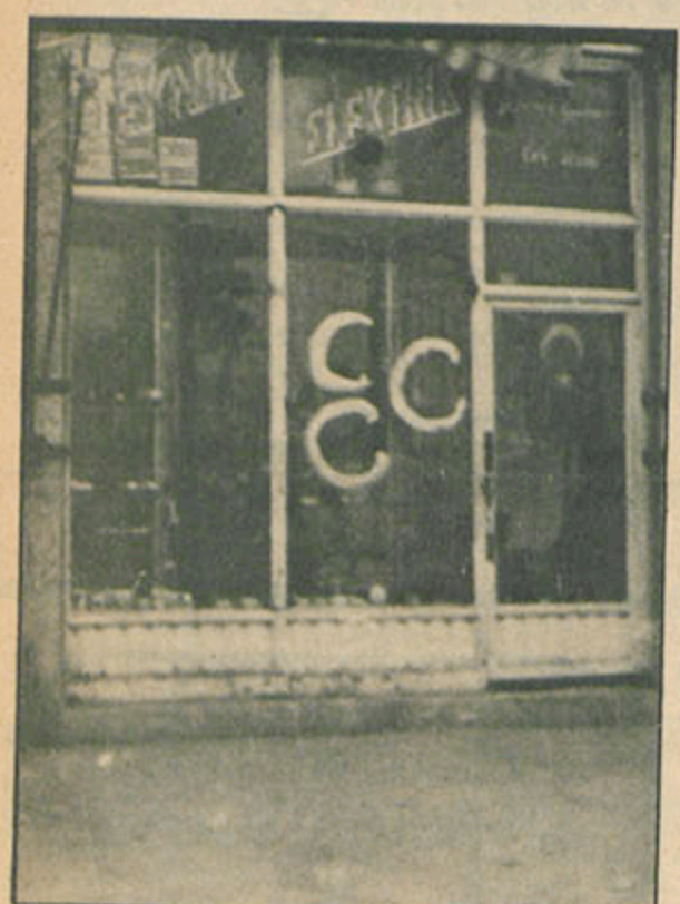
Bütün bir kent talan edilirken MHP ve üç hilal işareti bulunan yerlerde hiç bir saldırı belirtisi yok.