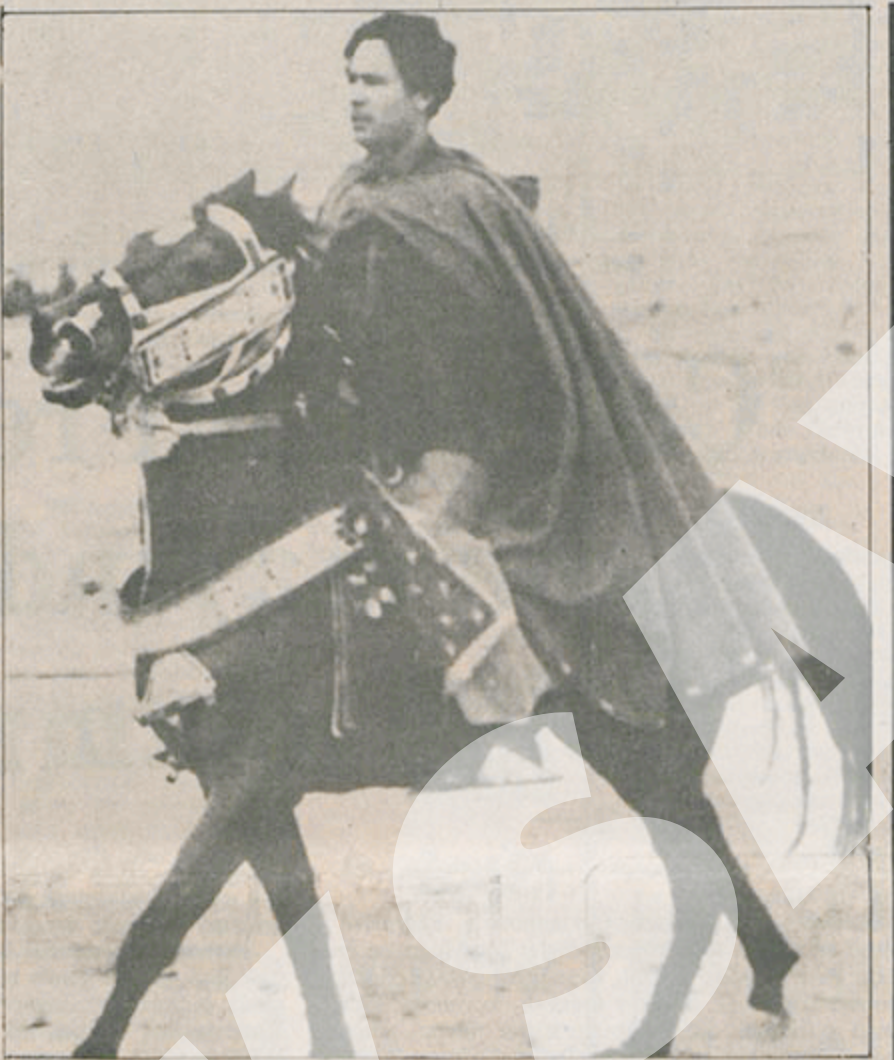
Libya Devrim Konseyi Başkanı Kaddafi.

Bunun üzerine, Fallaci Kaddafi'ye bu son dediğinin yalnızca bluff olduğunu, ABD ile Libya'nın çok iyi dost olduklarını ABD'nin, Libya'nın en iyi müşterisi konumunu sürdürdüğünü söyledi. Kaddafi, bu sav'a bir yanıt vermedi.