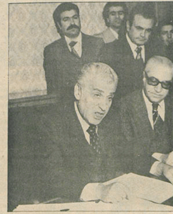
Gençlik ve Spor Bakanı Talat Asal.

Gençlik ve Spor Bakanı Talat Asal, bir süre önce Ankara Bölge Müdürlüğü'ne ait binalarda barınan sporcuların bu barınaklardan çıkarılmasına gerekçe olarak, "güvenlik açısından sakıncalı" olmayı gösterdi ve bu sporcuları bölücülükle suçladı.