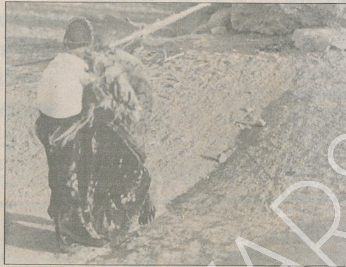
ASILIRLAR KUYUNUN İPİNE...GİDERLER GİDERLER BİR YUDUM SU İÇİN YAZ KIŞ DEMEDEN!