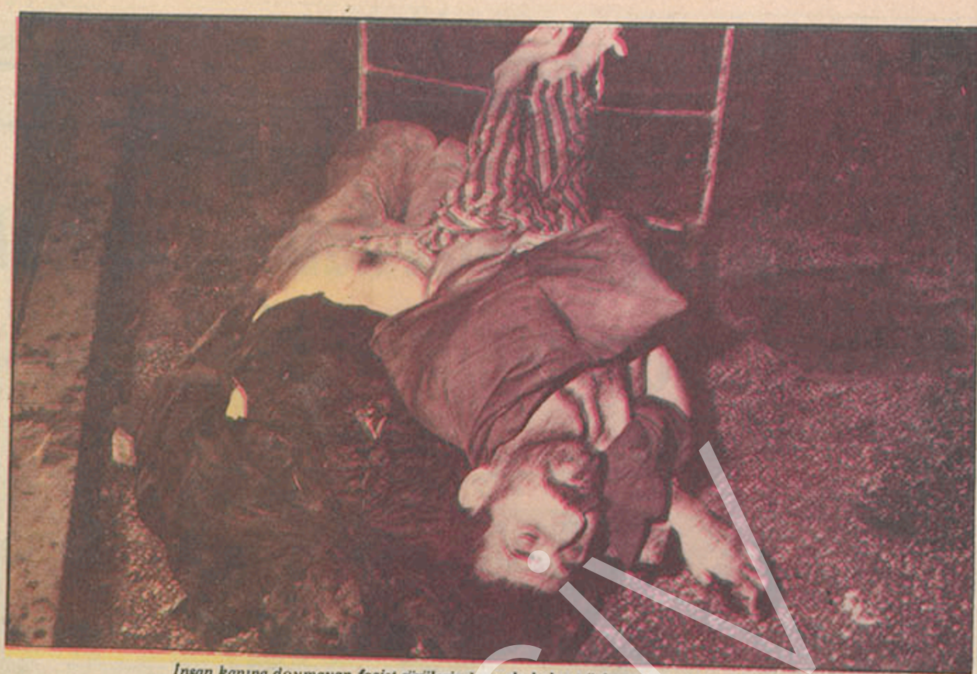
İnsan kanına doymayan faşist sürülerinde arada kalan yüzlerce ölü, yüzlerce yaralı...