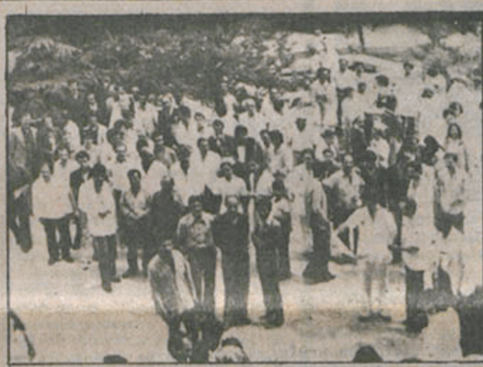
Sağlık emekçilerinin dünki direnişine Ankara Doktor Sami Ulus Hastanesi'nde çalışanlar da katıldı. Hastane personeli direniş boyunca acil servisler dışındaki bölümlerde iş bırakarak hastane bahçesinde toplandılar.