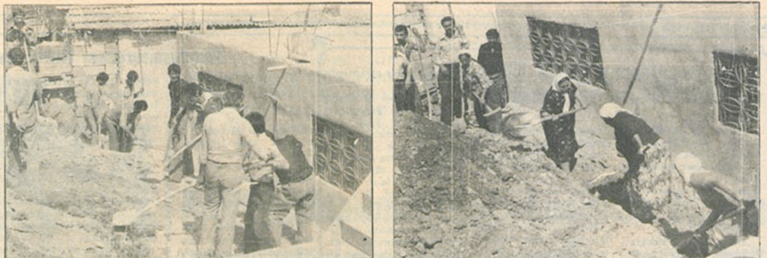
Daha önce kanalizasyon sorunlarını elbirliğiyle çözen Gültepe Çamlık halkı şimdi de sel sularının, talip ettiği yollarını cilele vemiş onarıyor, önlemler alıyorlar.