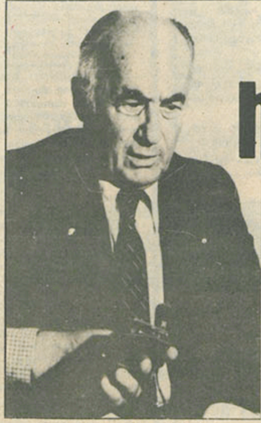
Dışişleri Bakanı Hayrettin Erkmen

Dışişleri Bakanı gensoruyu ciddi bulmadığını söyledi