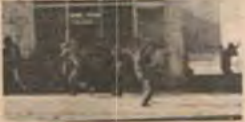
Jandarmalar böyle kaçıyordu...

● 29 Nisan günü en etkili direniş Tuzluca'yı ve İncirli semtlerinde oldu. Tuzluca'yı Libesinde düzenlenen gösteri sırasında akıyönetim kuvvetleri helikopterlerden ve panzerlerden halkın ve öğrencilerin üzerine yayılım ateşi açtılar. Yaralıları arasında bulunan devrimci anamız Menekşe Erbay daha sonra şehit oldu. Tuzluca'yı halkı kadınıyla, kızıyla, yaşıyla, genciyle akıyönetimle vahşetine bir kez daha dış - tırnağı ve silahıyla kahramanca direndi. Çatışma Abidinpaşa semtine kadar yayıldı ve uzun süre sokak aralarında devam etti. Öğrenciler de gaz bombaları ve otomatik tüfeklerle saldırıya geçen polis ve jandarmaya karşı ise binasına sığınarak uzun süre direndiler. İncirli semtinde de aynı şekilde akıyönetim kuvvetlerinin busede gösteri yapan halkın ve öğrencilerin üzerine ateş açması sonucu büyük bir çatışma çıktı. Bu çatışmalarda biri öğrencilerden, biri halktan ve biri de polis olmak üzere üç kişi yaralandı. Halk bir polis arabasına tahrip ederek kullanılmaz hale getirdi. Yollara ağaçlar ve taşlarla barikatlar kuruldu ve çatışma üç saat kadar devam etti. Devrimciler halkla birlikte polis karşı direnerek Piyangotepe'ye çekildiler.