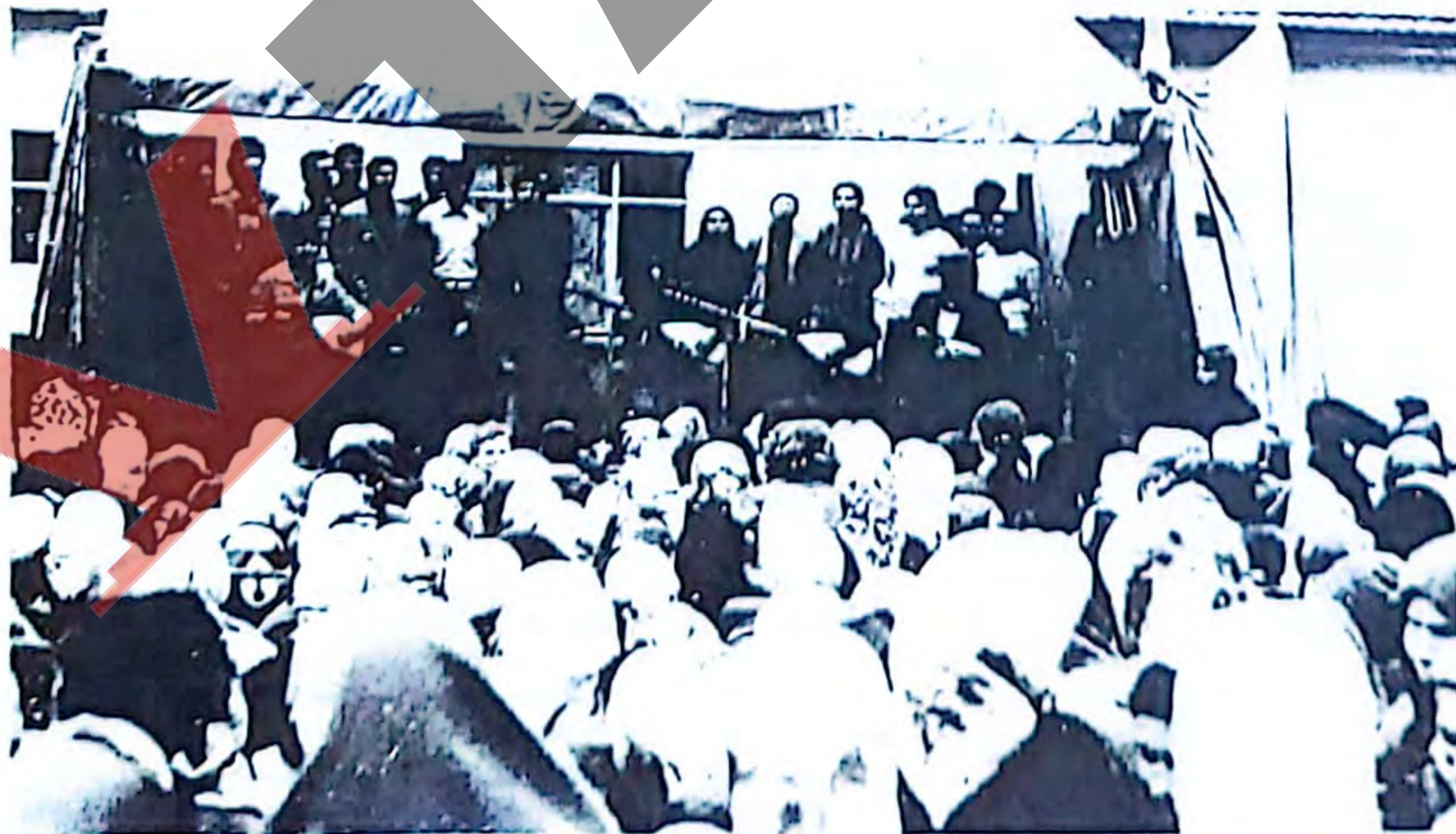
7'sinden 70'ine bacı, kardeş, ana, baba, tüm emekçiler Fatsa'da bir hafta boyunca devrimci kültürü yaratma doğrultusunda örnekler verdiler.