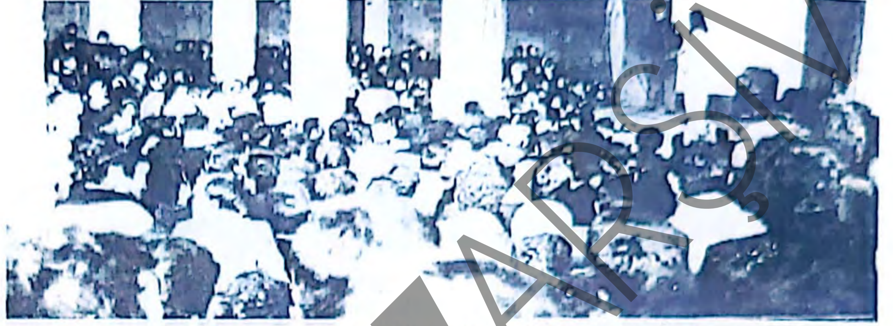
Fatsa'da Halk Şenliği boyunca yeni bir toplumsal dayanışma anlayışının tohumları serpiildi.

Böyle bir uğraşın bugün için "gerek-siz" olduğunu ve bütün bunların "devrim sonrası"na ait bir sorun olduğunu" söyleyenler bulunabilir. Bu tür düşünce eğilimlerinin